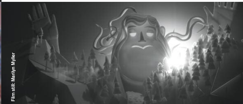
Film still: Marilyn Myller