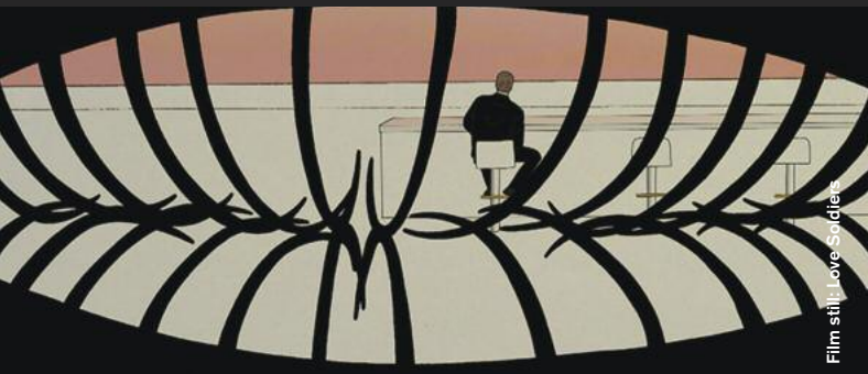
Film still | Love Soldiers

Animation / Afterwards: Screening Of This Year's Audience Award Winner Film!