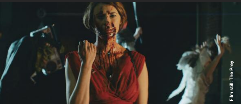
Film still: The Prey

Horror / Thriller / Black Comedy / Animation / Fantasy / Science Fiction